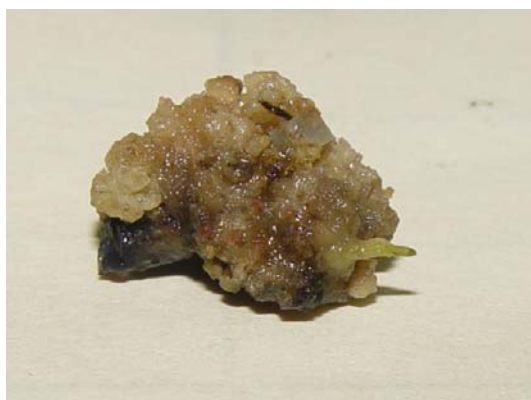
شکل ۱۱- اندام ساقه مانند در جداگشت ساقه ژنوتیپ اصفهان ۴

در شکل‌های زیر نمونه‌هایی از کال‌زایی جداگانه‌های مختلف ژنوتیپ‌های متفاوت آورده شده است. بازکشت انجام شد.