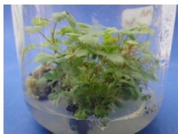
شکل ۱۶- تکثیر گیاه باززایی شده

اما در همین ژنوتیپ پس از القای کال‌زایی و شوک گرسنگی جنین‌زایی نیز در زیر میکروسکوپ مشاهده گردید (شکل ۱۷) ولی پس از مدتی از بین رفت.