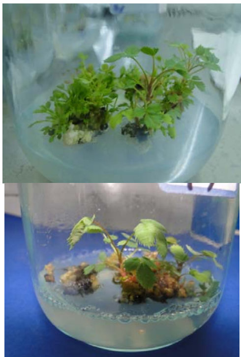
شکل ۱۵- باززایی در جداکشت ساقه ژنوتیپ اصفهان ۴

در نهایت گیاه باززایی شده در محیط BA+0.01mg/l IBA MS+3mg/l تکثیر گردید تا برای اهداف بعدی مورد استفاده قرار گیرد (شکل ۱۶).