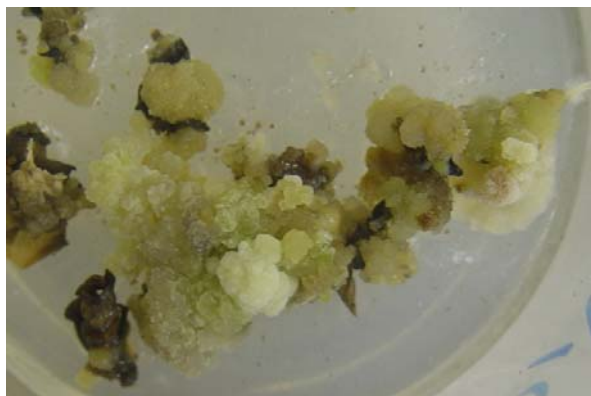
شکل ۲- ایجاد کالوس از گلبرگ ژنوتیپ یزد ۲ در محیط MS+9mg/l PCPA+1 mg/l Kin