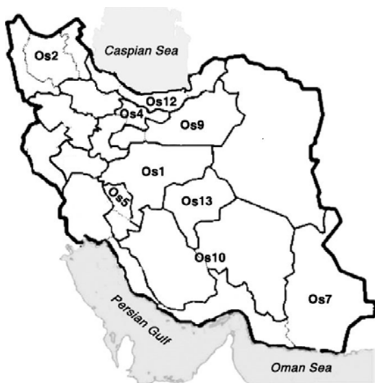
شکل ۱- نقشه محل جمع‌آوری ژنوتیپهای مختلف

کال‌زایی: در ابتدا جهت کال‌زایی از محیط کشت MS (۲۱) حاوی ترکیبهای مختلف هورمونی استفاده گردید (جدول ۲).