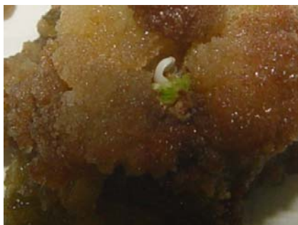
شکل ۱۷- جنین‌زایی در جداکشت ساقه ژنوتیپ اصفهان ۴

اما در همین ژنوتیپ پس از القای کال‌زایی و شوک گرسنگی جنین‌زایی نیز در زیر میکروسکوپ مشاهده گردید (شکل ۱۷) ولی پس از مدتی از بین رفت.