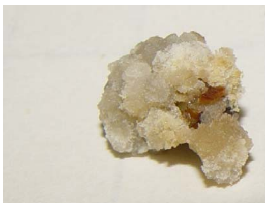
شکل ۶- القای کالزایی در ساقه بلوچستان ۱ در محیط B5+2mg/l 2,4D+1.5 mg/l Zeatin