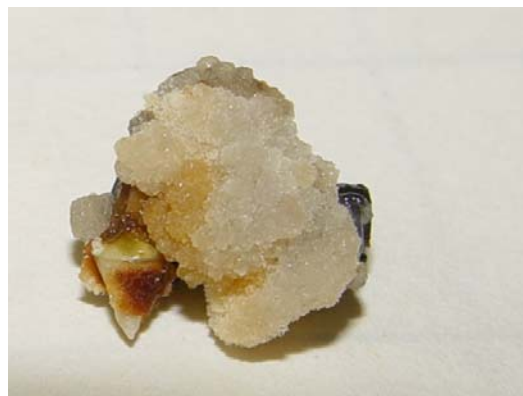
شکل ۸- القای کال‌زایی در ساقه بلوچستان ۱ در محیط MS+5mg/l PCPA+1 mg/l Kin

جدول ۴- مجموع مربعات حاصل از تجزیه واریانس تیمارها بر اساس اثر نوع ترکیب هورمونی و ژنوتیپها به طور جداگانه در میزان کل کال‌زایی.