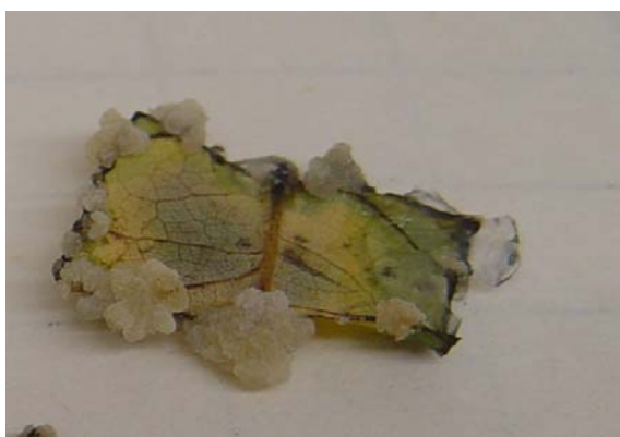
شکل ۵- القای کالزایی در برگهای گلستان ۱ در MS+5mg/l محیط PCPA+1 mg/l Kin