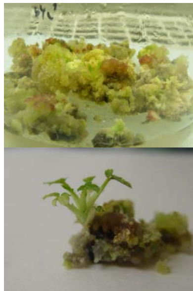
شکل ۱۴- اندام‌زایی در جداکشت ساقه ژنوتیپ اصفهان ۹

در نهایت در محیط باززایی MS+6mg/l BA +2mg/l 2,4D +2 mg/l Kinitin چندین ساقه به همراه برگ دیده شد (شکل ۱۴).