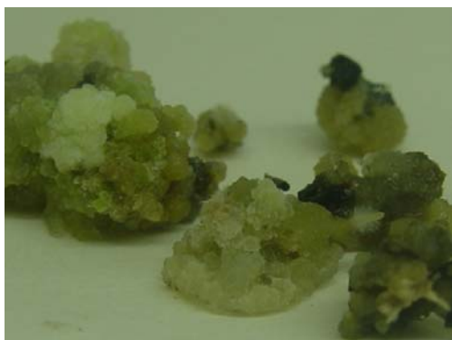
شکل ۱۳- ایجاد ریشه در کالوس القایی از گلبرگ ژنوتیپ یزد ۲

از کالوس القایی از ریزنمونه‌های ساقه ژنوتیپ اصفهان ۱۰ در محیط MS ریشه به دست آمد (شکل ۱۲). همچنین ایجاد ریشه در کالوس القایی از گلبرگ ژنوتیپ یزد ۲ دیده شد (شکل ۱۳).