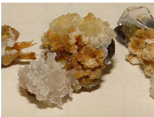
شکل ۷- القای کالزایی در ساقه اصفهان ۴ در محیط B5+2mg/l 2,4D+1.5 mg/l Zeatin