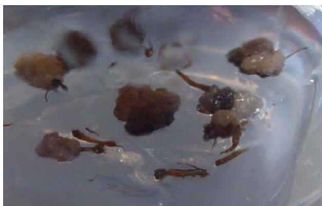
شکل ۴- ایجاد کالوس از سبلة ژنوتیپ اصفهان ۹ در محیط B5+2mg/l 2,4D+1.5 mg/l Zeatin