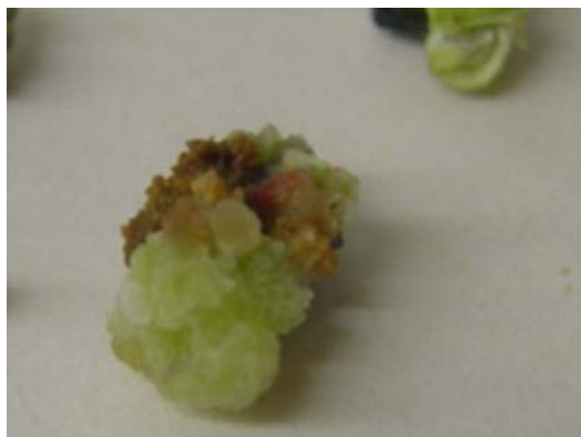
شکل ۹- القای کال‌زایی در ساقه اصفهان ۹ در محیط MS+5mg/l PCPA+1 mg/l Kin