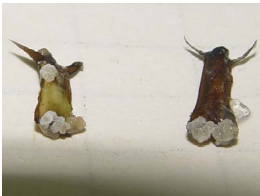
شکل ۳- القای کالزایی در گوشوارکهای ژنوتیپ گلستان ۱ در محیط B5+2mg/l 2,4D+1.5 mg/l Zeatin

کالزایی برده شد. از نظر میزان کل کالزایی (جدول ۴) تأثیر ژنوتیپ، ترکیبات هورمونی و نیز اثر متقابل آنها