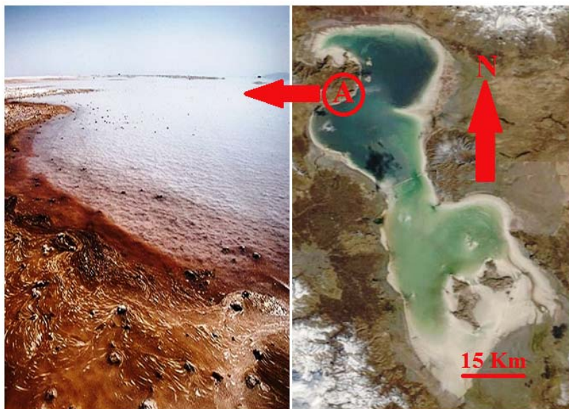
شکل ۱- عکس هوایی دریاچه ارومیه. A: ایستگاه نمونه برداری - تفرجگاه باری.

با استفاده از روش کروماتوگرافی یونی اندازه‌گیری شد. در این تکنیک ابتدا آب نمونه برداری شده بلافاصله با آب دیونیزه رقیق‌سازی شده و سپس با فیلتر ۰/۴۵ میکرون فیلتر شد. اندازه‌گیری آنیونها و کاتونها به ترتیب با