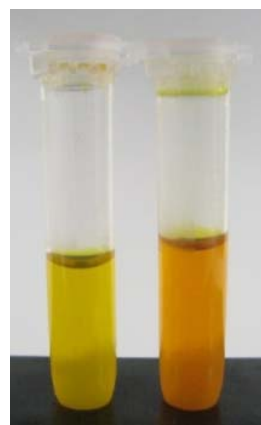
شکل ۳- سنجش فعالیت آنزیمی کیتیناز به‌وسیله رنگ‌سنجی با DNS سمت چپ، شاهد و سمت راست، نمونه حاوی آنزیم کیتیناز

تراریخته شده بود، نسبت به نوع غیر تراریخته آن از خود فعالیت حشره‌کش بیشتری را نشان داد (۱۰). Sheng و همکاران در سال ۲۰۰۲، کیتیناز جدیدی را در Bacillus brevis شناسایی و جداسازی کردند که این کیتیناز بر روی ژل اکریل امید وزن مولکولی ۸۵ کیلو دالتون را نشان داد؛ در حالی که با جوشاندن و تیمار آن با اوره یک مولار در دمای ۵۰°C به مدت ۱۰ دقیقه، این کیتیناز به ۴۸ کیلو دالتون میل می‌کرد (۱۴). در سال ۲۰۱۳، Saima و همکاران نشان دادند که دو گونه باکتریایی A. hydrophila HS4 و A. punctata HS6 قادر به تولید مقدار خیلی زیادی کیتیناز در زمان کم هستند و هر دو گونه جدا شده از ائروموناس قادر به تولید کیتیناز بین دمای ۲۲ و ۴۰ درجه سانتیگراد هستند که دمای لازم برای کشت محصول در هند می‌باشد که می‌توانند جهت ایجاد شرایط لازم برای مقابله با قارچ‌های پاتوژن گیاهی به‌کار روند (۱۱). در سال